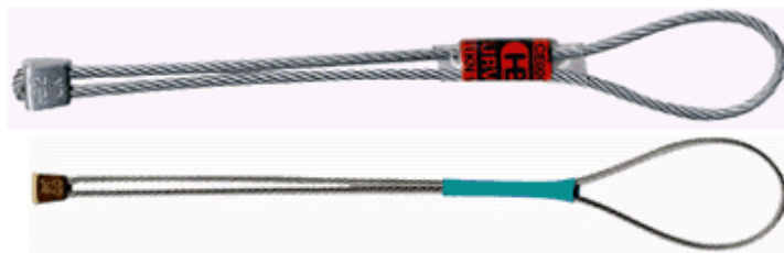
Alumínium (fent) és réz ék (lent)

Anyagukat tekintve készülhetnek alumíniumból, bronzból vagy acélból (keverék anyagból). Elvük, hogy rántás hatására elkenődnek a repedés falában. A különbség, hogy mind más mértékben. Az ékek legjobban kompakt függőleges oldalfalú repedésekben tartanak biztosan, és ferde vagy vízszintes repedésekben a legnagyobb a valószínűsége, hogy kirántjuk azokat helyükről. A legfontosabb a kötélvezetés, a megfelelő kihosszabbítás. Megoldás lehet még, az egymással ellentétes irányba összehúzott ékek használata, melyet napjainkban csak ritkán használnak a gyakorlatban.