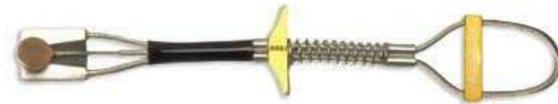
Kis méretű Lowe Ball (BallNuts)

Azonban tudni kell, hogy a nagyobb, vastagabb friendekhez képest a keskeny tengelyszélességgel rendelkező cam-ek teherbírása is kisebb.