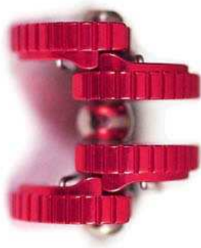
A Wild Country szerkezete felülnézetből

Bizonyos helyzetekben (kritikus szituációkban, ék vagy friend mérethiány esetén) előfordul, hogy a friendet ékként, teljesen nyitott pofaállással helyezzük el. Ez a használat megfelelő típust, és konstrukciót feltételez. Tartóerejük azonban nem egyezik meg a zárt, rendeltetésszerű használathoz vonatkozó értékekkel. Bizonyos gyártók a pofák találkozásánál barázdákat helyeznek el, megakadályozandó az összecukódást. Ez a vásárlásnál is fontos szempont lehet.