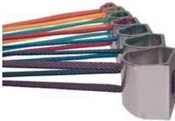
Hexcentrikus ékek varrott Dyneema hevederen

Az ékek kritikus pontja szinte minden esetben a felfűzés. Lehet sodronyos (acél), kötélgyűrűs, vagy ékeink lehetnek hevederen. Ezt elsősorban annak mérete határozza meg. A kis ékbe csak kis (5 mm-nél kisebb) kötélgyűrűt fűzhetünk, aminek teherbírása nem elégséges. Így ezeknél praktikusabb a sodronyos változat. A „hexiknél” alkalmazhatunk kötélgyűrűt, aminek csomóját a hatlap profilba lehet elhelyezni, hogy az ne zavarjon bennünket. Ma már azonban a varrott hevederek (Dyneema, stb.) a korszerűbbek, a gyakorlatban praktikusabbak. A teherbírás alaptétele, hogy a köztest (ékünket) minden esetben a kötélben ébredő Fangstoss kétszerese éri. Ennek megfelelően válasszuk ki melyik éket/ékeket, hova helyezzük.